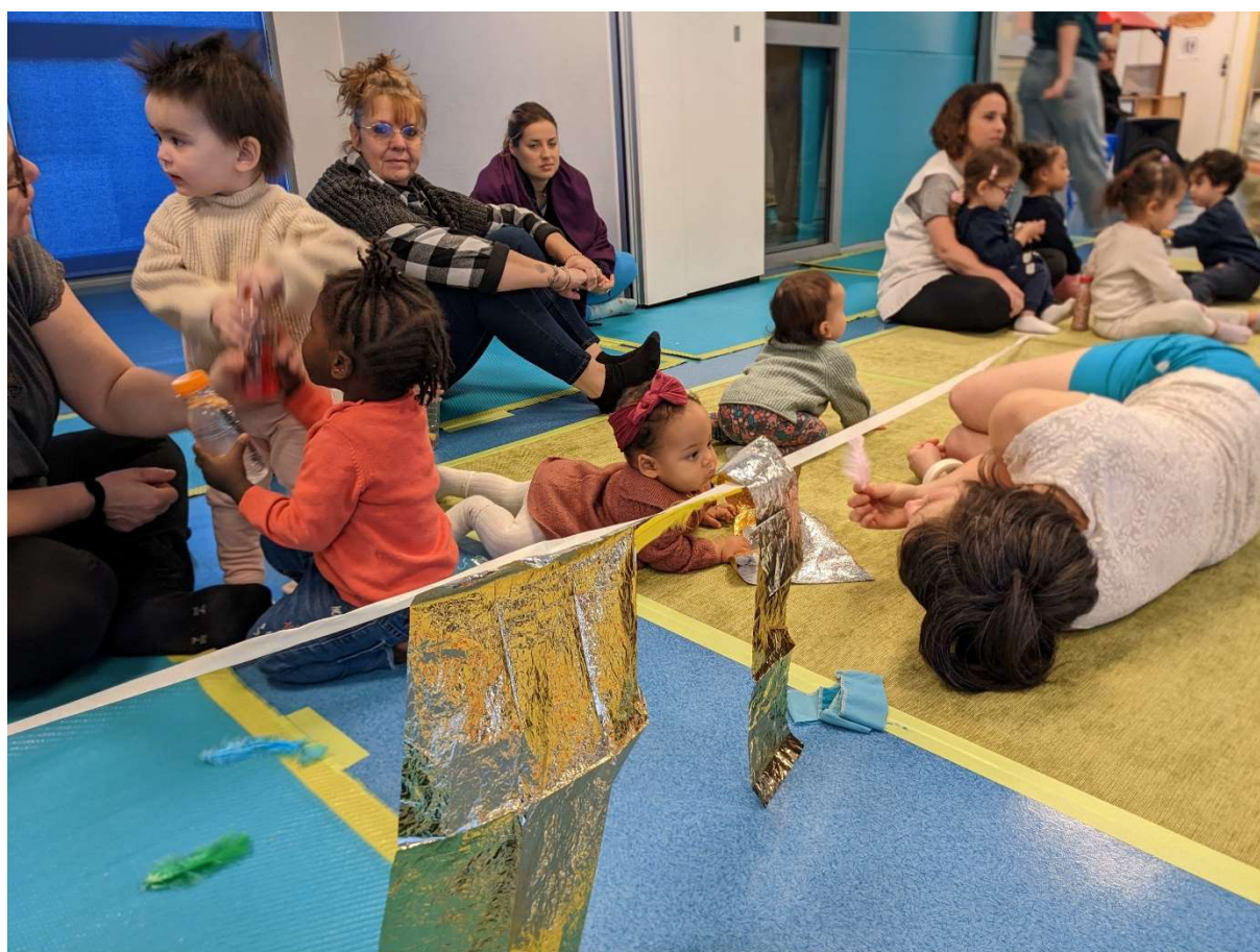
Spectacle A l'orée en crèche – Cie L'éclaboussée

Pendant ce temps d'atelier, les encadrants de la Petite Enfance ont exploré le mouvement, le geste du peintre et la voix comme processus créatifs. L'idée étant de ressentir ce que ces trois pratiques mettent en jeu, dans le corps, dans le dialogue et dans la construction d'un espace de partage et d'écriture d'un moment improvisé.