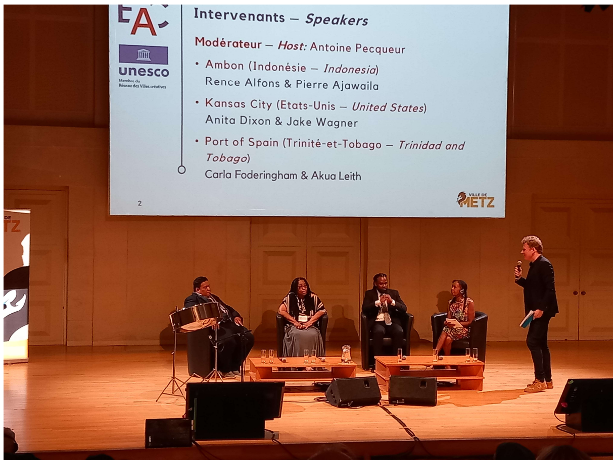
Table ronde 1 - Exprimer l'identité culturelle par la musique