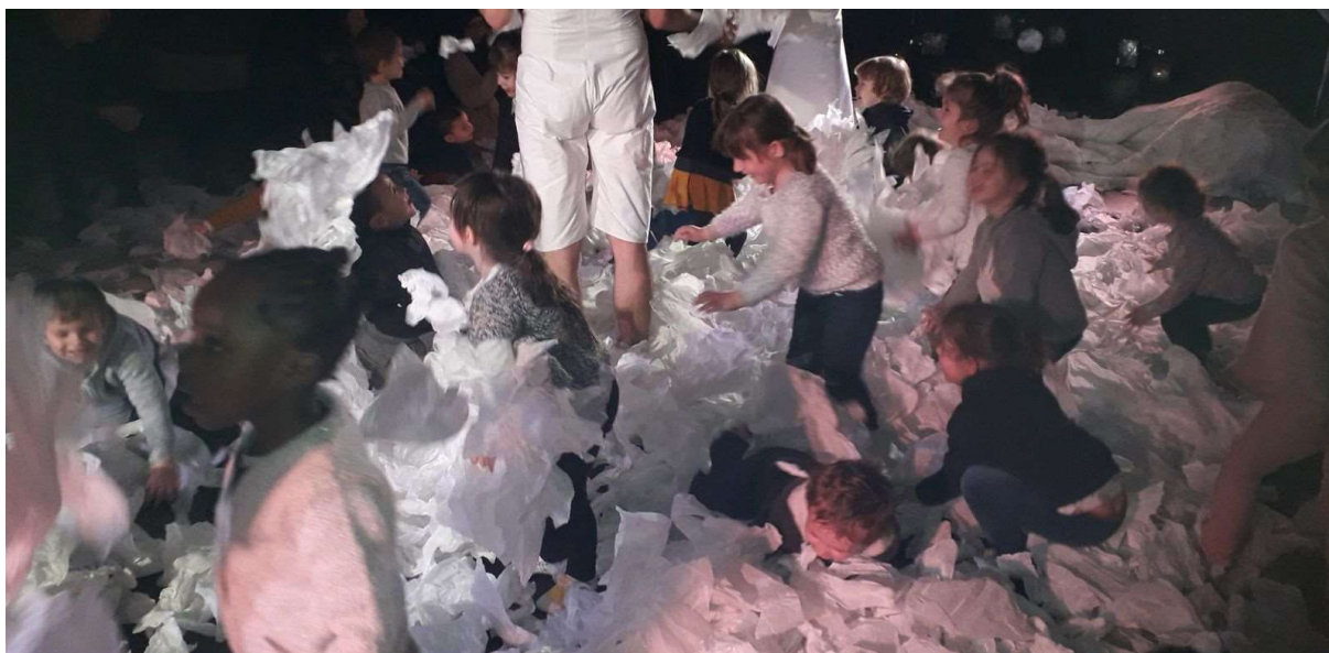
Spectacle Sous la neige, Cie Les Bestioles

Toutes formes d'éveil artistique et culturel peuvent être proposées dès la naissance car le jeune enfant est très spontanément attiré par le visage humain, la musique, les images, le mouvement, la nature. On peut bien évidemment jouer, chanter, raconter des contes et des histoires, soit spontanément, soit avec le support d'un livre, faire de la lecture, expérimenter des arts plastiques, patouiller, expérimenter différentes matières, danser, danser ou juste laisser son corps s'exprimer et favoriser des temps pendant lesquels l'enfant est spectateur de théâtre, de marionnettes, d'histoires illustrées.