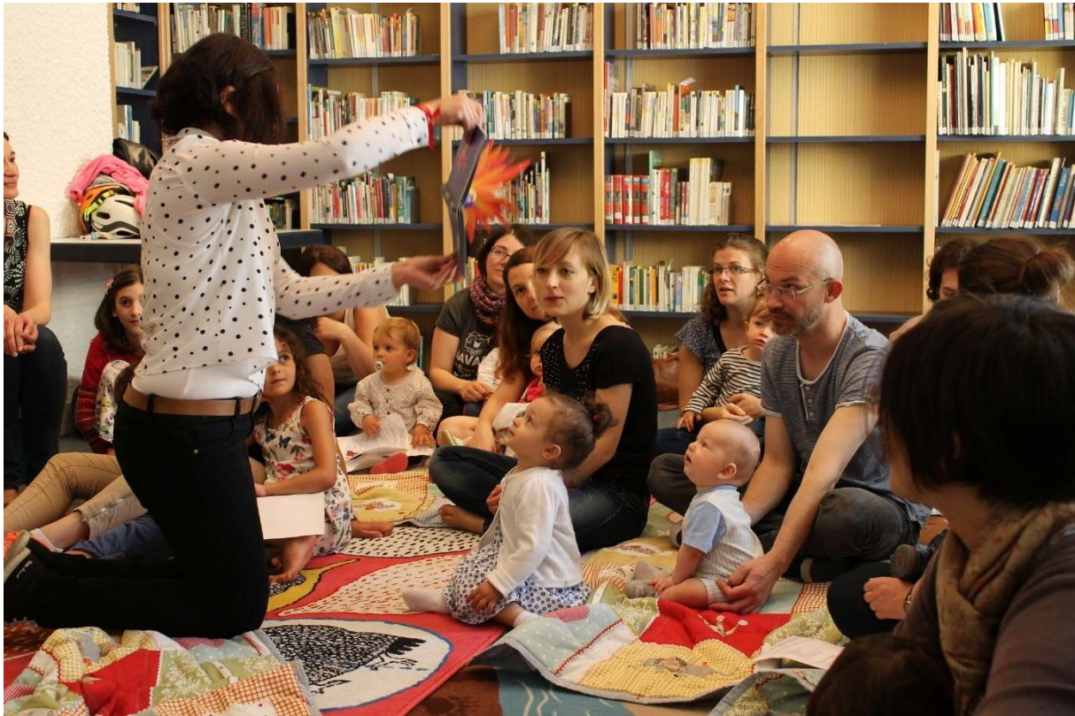
Ile aux bébés @Bibliothèques-médiathèques de Metz

A Metz, dans les établissements d'accueil du jeune enfant, les crèches, les ludothèques et dans toutes nos actions qui sont en lien directement avec les parents, on essaye de toujours prendre en compte la culture d'origine des parents et leur milieu social. On entre en relation avec eux, on prend des informations qui permettent de bien accueillir l'enfant : comment s'est passée la naissance ? Quels sont ses besoins ? Quelles sont ses habitudes de vie ?