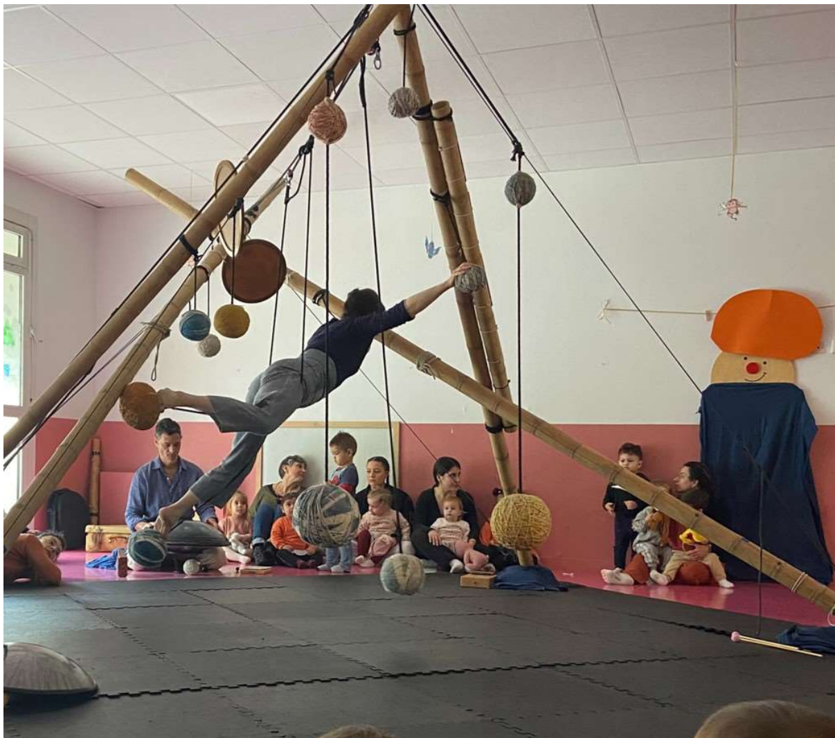
Spectacle Twinkle en crèche – Cie Lunatic