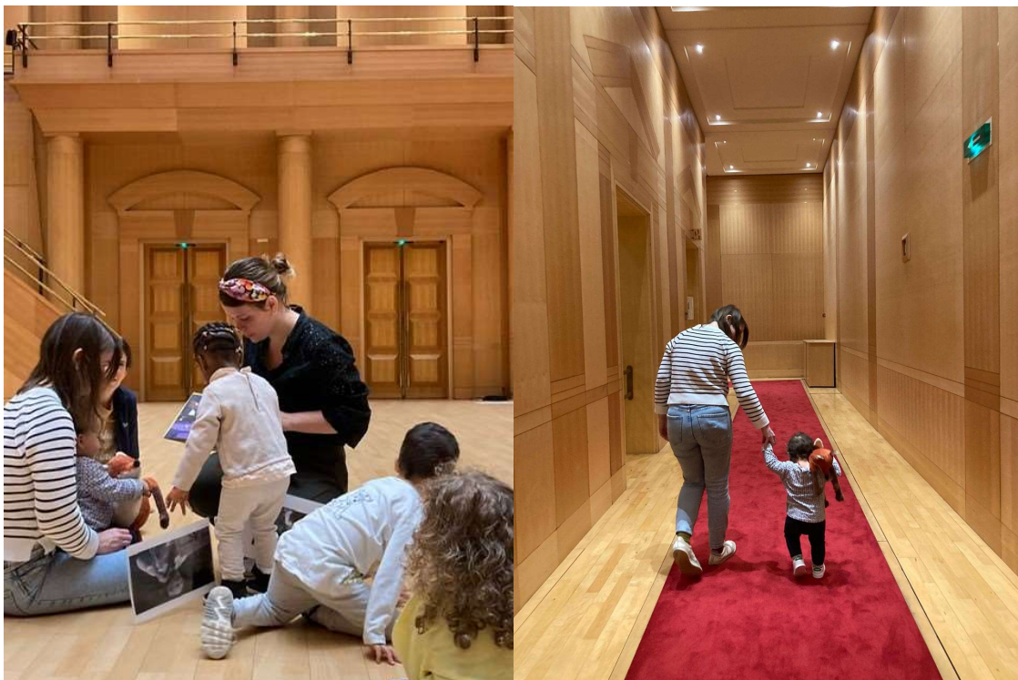
Visite de l'Arsenal pour les tout-petits @ Cité Musicale-Metz

Enfin, en lien avec les Bibliothèques-médiathèques de la Ville de Metz, la Cité musicale-Metz a conçu un format léger et multi-sensoriel, les îles aux bébés musicales. Le défi est de faire participer davantage les parents, c'est pourquoi le format évolue. 6 mamans du quartier de Borny, issues d'autres pays et accueillies au centre social Cassis, ont été formées à animer des îles aux bébés. Elles ont choisi les albums avec les bibliothécaires et ont appris à raconter. Ces mères ont pu animer leur première île aux bébés lors de la fête du quartier « Voilà l'été » organisée à la BAM. La Cité musicale-Metz souhaite pérenniser cette initiative.