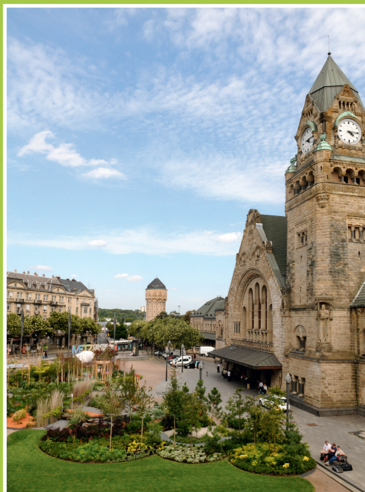
La gare de Metz et le château d'eau