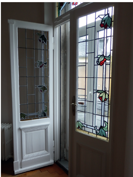
Détail de l'intérieur des Douanes au n°18 boulevard Georges Clémenceau

Dans le périmètre du secteur sauvegardé, le PSMV se substitue au Plan Local d'Urbanisme (PLU). Ce dernier s'applique encore sur le territoire du secteur sauvegardé (hors ancien périmètre) dans l'attente de la révision en cours du PSMV.