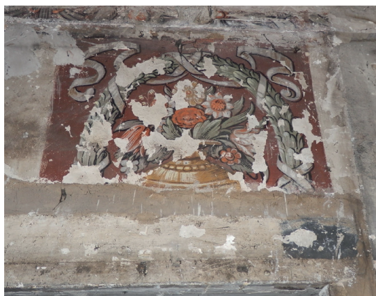
Peinture murale découverte en 2013 lors de travaux rue aux Ours

Il est conseillé de présenter les avant-projets à l'ABF, en amont du dépôt officiel, soit en permanence le mercredi (sur rendez-vous), soit par courriel, télécopie ou courrier. Des fiches-conseils thématiques (ravalement, menuiseries, couvertures, enseignes...) sont également disponibles sur le site Internet de la DRAC.