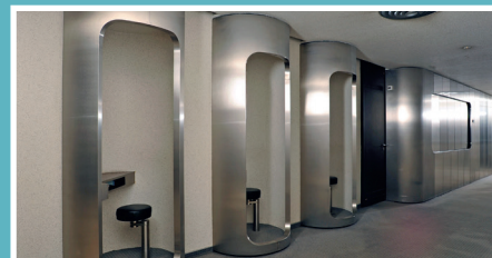
Aménagement de Robert Anxionnat : cabines téléphoniques et vestiaires à la préfecture de la Moselle

À l'issue de l'enquête publique, le Conseil municipal se prononcera sur le projet de PSMV qui sera applicable par arrêté préfectoral à l'horizon 2018.