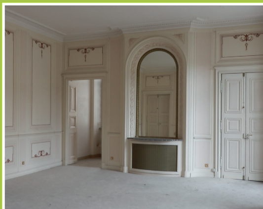
Détails de l'intérieur de l'ancien hôtel particulier au n° 1 rue d'Asfeld

Isabelle MICHARD Architecte des bâtiments de France Chef du STAP de la Moselle 10,12 place Saint-Étienne - 57000 METZ Tél. 03 87 36 08 27 Ouverture au public de 10h à 12h et de 14h à 16h, du lundi au vendredi et sur rendez-vous www.culturecommunication.gouv.fr/Regions/Drac-Lorraine