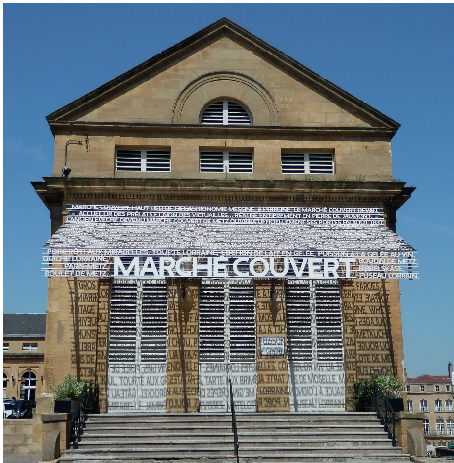
L'aile droite du Marché couvert agrémentée d'un auvent selon Ruedi Baur, designer